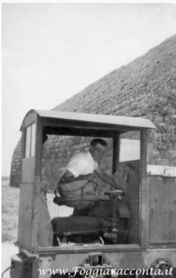
Un dipendente dell’I.P.Z.S alla guida del trenino

volta e immessa nell’impianto “Trinciapaglia” dove aveva inizio il processo di lavorazione e trasformazione in cellulosa. Per questo compito veniva impiegata una forza lavoro di 20 soci.