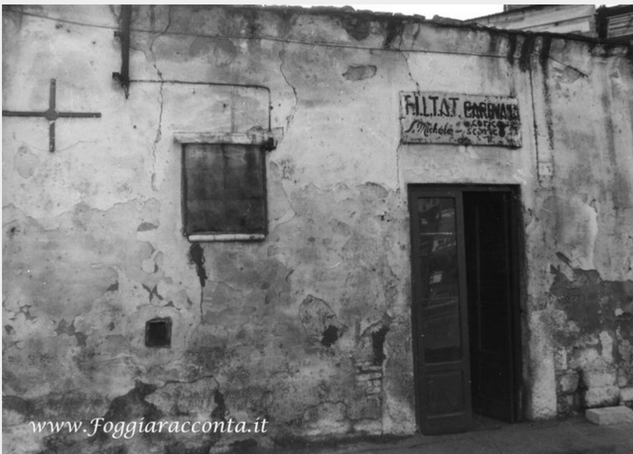
La vecchia sede della cooperativa San Michele in via Sant'Eligio a Foggia