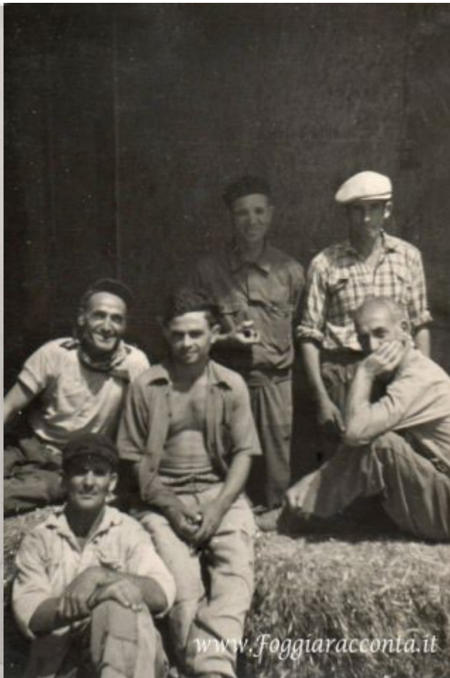
Alcuni soci-lavoratori della Nuova San Michele