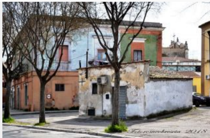
La casetta che ospitò la sede della cooperativa San Michele, in via Sant'Eligio 23 a Foggia.